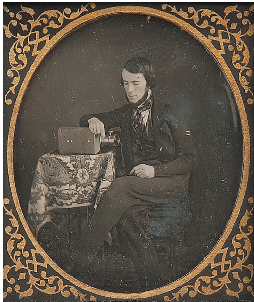
写真家C・D・カフーンのセルフポートレート C・D・カフーン 1845年頃 ダゲレオタイプ

新型コロナウイルスの影響により、展覧会やイベントが中止・延期になる場合がございます。最新情報はホームページ等でご確認ください。