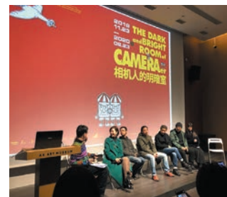
オープニング・トーク