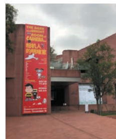
展示会のバナーがかかった A4 Art Museum外観