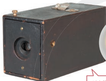
ザ・コダック/ イーストマン乾板 & フィルム・カンパニー/ 1888年