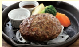
山形牛 100%ハンバーグ