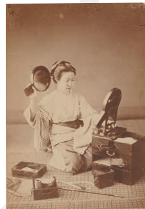
鏡を見る女/ 制作者・ 制作年不詳

幕末～明治にかけて、来日した外国人のお土産用に日本の風景、風俗等を撮影した写真が大量に販売されました。これらの写真は開港地横浜を中心に制作されていたため「横浜写真」と呼ばれています。