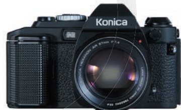
コニカ FS-1/ 小西六写真工業株式会社/1978年