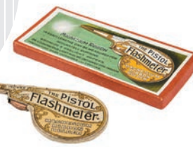
ザ・ピストル・ フラッシュメーター/ 製作者・制作年不詳