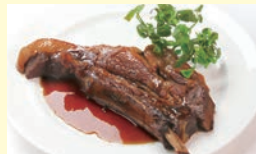
日向の豚スペアリブ