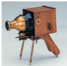
レスコベット/ アルペール・ダリエ/ 1888年