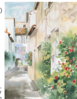
セラニウムの咲く路地- 南フランス・アンティープ 青木美和