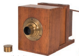
アマデ・ケズラン・ ダゲレオタイプカメラ/ アマデ・ケズラン/ 1843年