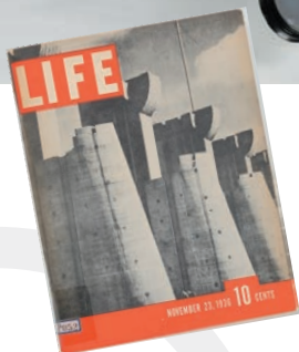
「ライフ」1936年11月23日号(創刊号)/ タイム・インコーポレイテッド出版