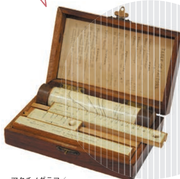
アクテノグラフ/ ハーター&ドリフィールド/1888年

世界で最初の露出計。箱の中に収められた日時、天気、乾板の感度が記載されたバーをセットすると、絞りとシャッタースピードの最適な組み合わせを知ることができます。