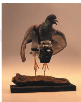
ドッペル・ シュポルト/ ユリウス・ ノイロンナー/ 1908年頃

100枚撮りの紙ベースのロールフィルムが入った状態で販売されたカメラ。撮影後はカメラごと現像に出すと、プリントと新しいフィルムを詰めたカメラが返送されます。「あなたはボタンを押すだけ、あとは私たちがやります」というキャッチコピーで売り出されました。