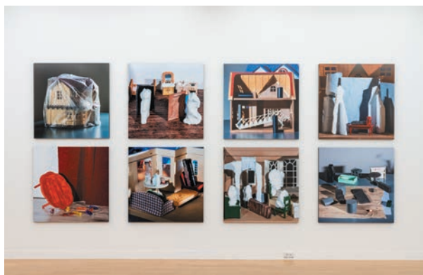
1,2. とどまってみえるもの 会場風景 photo: Ken Kato 3. コレクション展 photo: Ken Kato 4. コロタイプ・ワークショップ