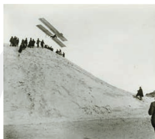
1904ーメルリモン、ガブリエル・ヴォアザンの最初の飛行/ ジャック・アンリ・ラルティエグ/ 1904年

幕末～明治にかけて、来日した外国人のお土産用に日本の風景、風俗等を撮影した写真が大量に販売されました。これらの写真は開港地横浜を中心に制作されていたため「横浜写真」と呼ばれています。