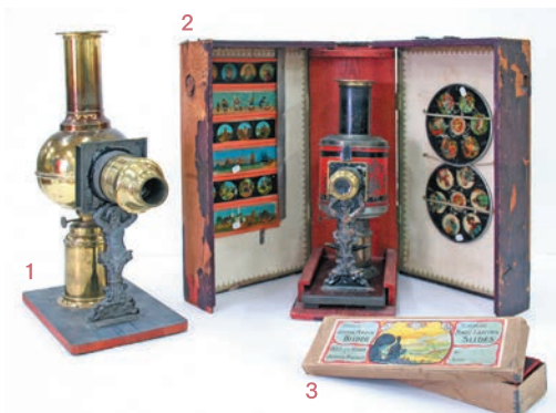
1. 幻燈機/製作者不詳/1880年頃 2. 幻燈機・スライドセット/製作者不詳/1882年頃 3. スーパーファイン・マジック・ランタン・スライド/ ゲブリューダー・ピング/制作年不詳