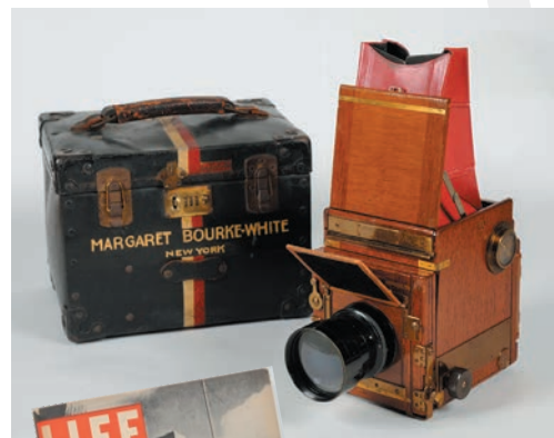
ソホ・トロピカル・レフレックス/ ソホ・リミテッド/1935年