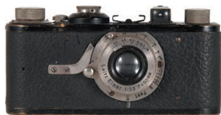
ライカ I(A)/ エルンスト・ライツ・ ゲーエムベーハー/ 1925年

ライカの最初の市販モデル。小型ながら精巧なライカのつくりは、後のカメラに大きな影響を与えました。ライカが採用した24×36mmの画面サイズは、デジタルカメラのイメージセンサーの「フルサイズ」と呼ばれる規格にも踏襲されています。