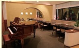
ゆったりとした空間でお茶・お食事を♪