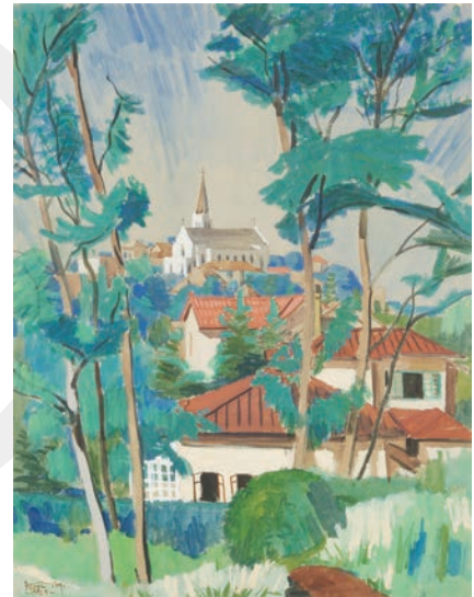
三橋兄弟治(教会の見える風景) 1939年/水彩、紙/74.0 × 57.0cm

お問い合わせ 〒220-0031 横浜市西区宮崎町26-1 TEL: 045-315-2828 FAX: 045-315-3033 ホームページ: https://ycag.yafjp.org/