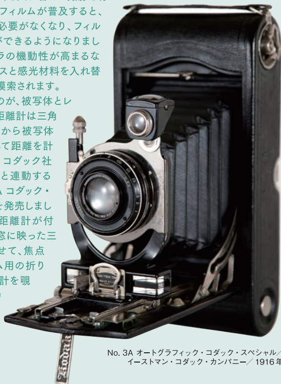
No. 3A オートグラフィック・コダック・スペシャル/ イーストマン・コダック・カンパニー/ 1916年

そこでカメラに取り入れられたのが、被写体とレンズの距離を計る距離計です。距離計は三角測量の原理を元に、二つの位置から被写体を見た時に生じる視差を利用して距離を計ります。1916年にイーストマン・コダック社は、世界で初めて焦点調節機構と連動する距離計を装備したカメラ、No.3A コダック・オートグラフィック・スペシャルを発売しました。このカメラはレンズ下部に距離計が付き、側面の三層に分かれた覗き窓に映った三つの像を、ノブを回して合致させて、焦点調節を行います。ロールフィルム用の折り畳み式カメラで、手持ちで距離計を覗きながら撮影できる先駆的なカメラとなりました。