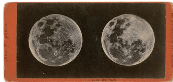
J・P・ソール／満月／19世紀