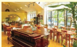
ゆったりとした空間でお茶・お食事を♪