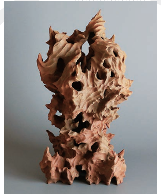
ヒルコ / 2020年 / 陶土

👤 中学生以上 14名 (応募者多数の場合、抽選) 💰 2,500円 (材料費・焼成代込、全2回分) 👤 茂田真史 ※ホームページ「申込フォーム」からお申込みください。