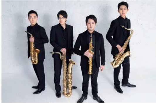
The Quartet "Oiseaux"

1/8(日) 横浜都筑太鼓 太鼓の演奏と獅子舞で 初春を祝います 📍 正面玄関前