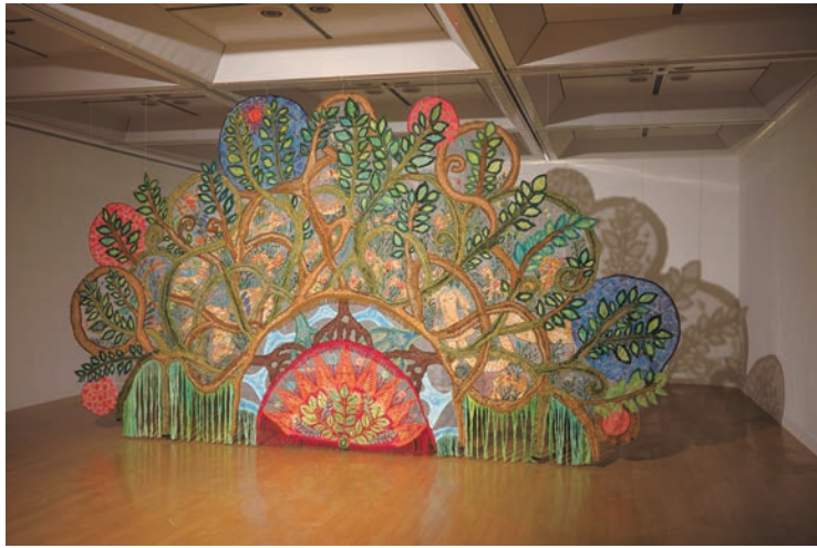
1,2,3. 会場風景