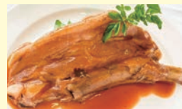
日向の豚スペアリブ