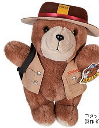
コダック宣伝用熊のぬいぐるみ/ 製作者・製作年不詳

エントランスロビーに設けたショーケースで、 横浜市所蔵カメラ・写真コレクションを紹介しています。