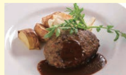
山形牛100%ハンバーグ