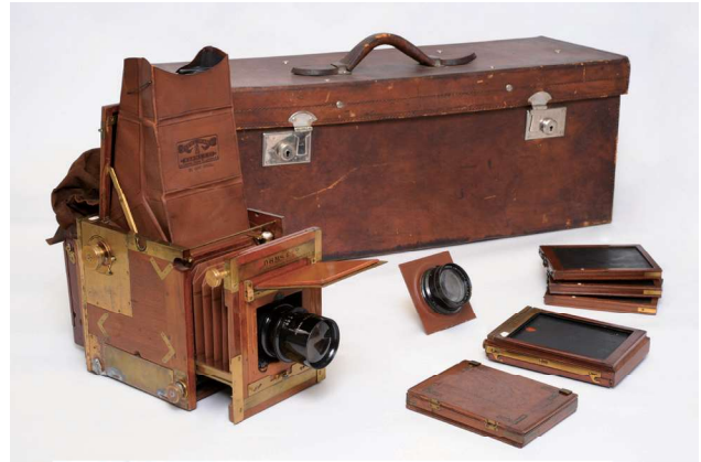
アダムス・トロピカル・ミネックス/アダムス & カンパニー/ 1909年