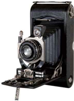
No. 3A オートグラフィック・コダック・スペシャル /イーストマン・コダック・カンパニー/ 1916年

本展では、撮影者と被写体、写真を見る人と被写体の距離、カメラが持つ距離に関する機構など、写真にまつわる様々な「距離」をキーワードに、写真技術の発展と写真表現の関係を探ります。