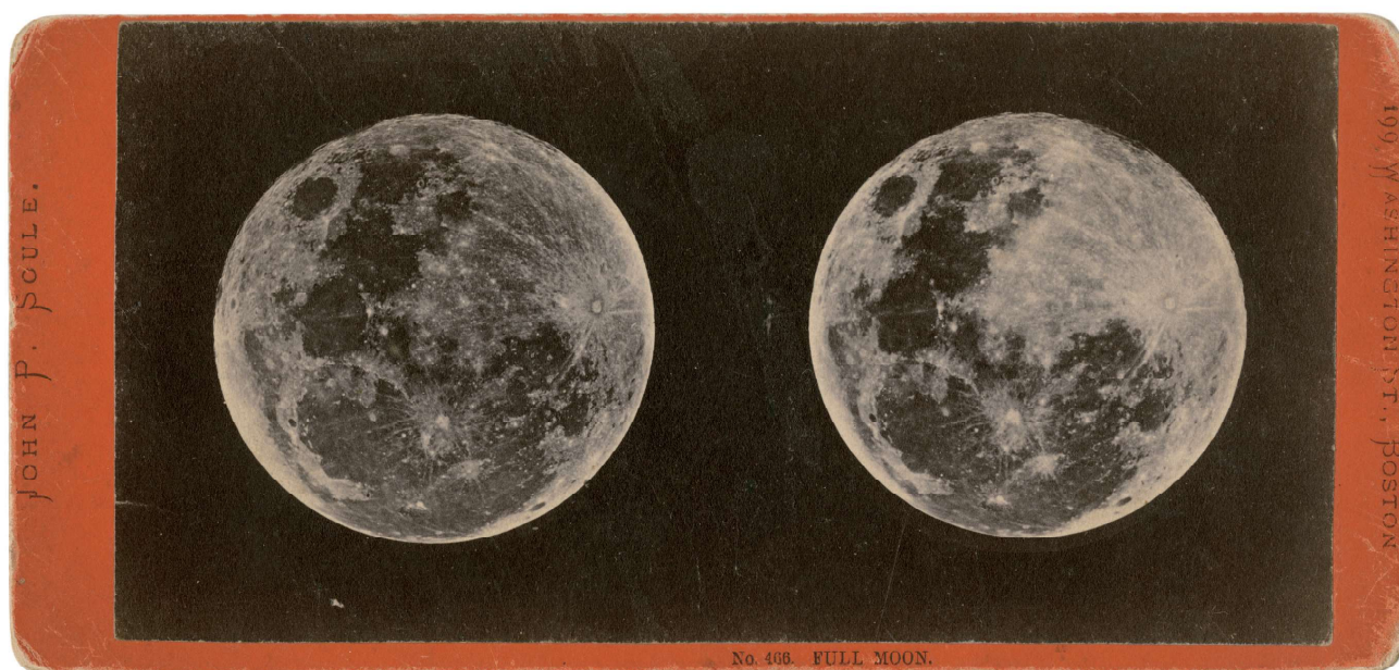
満月 / J・P・ソール / 19世紀