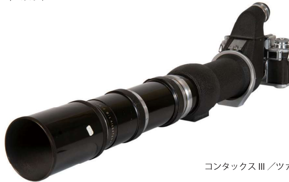
コンタックスⅢ/ツァイス・イコン・アーゲー/ 1936年

※ぜひともこの機会にご取材いただきますよう、お願いいたします。提供可能な広報用画像がございますので、ご入用の際にはご請求ください。