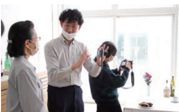
ワークショップ「あなたのカメラのレンズ活用術」

2023年1月28日(土)～2月26日(日)全30日間 観覧会入場者数6,279人+関連事業参加者数208人 合計6,487人