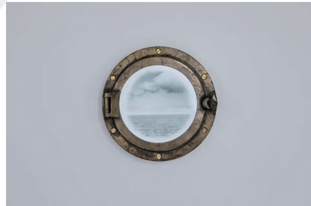
鈴木 のぞみ / The Rings of Saturn: 舷窓-アイリッシュ海 / 2020年