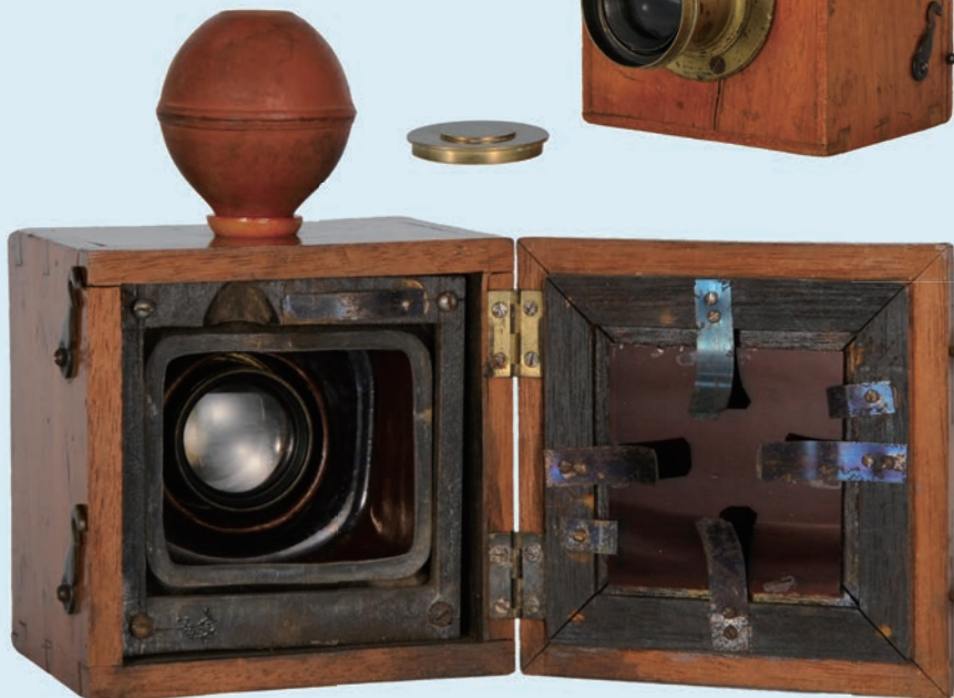
デュブロン No.2 /メゾン・デュブロン / 1864年頃