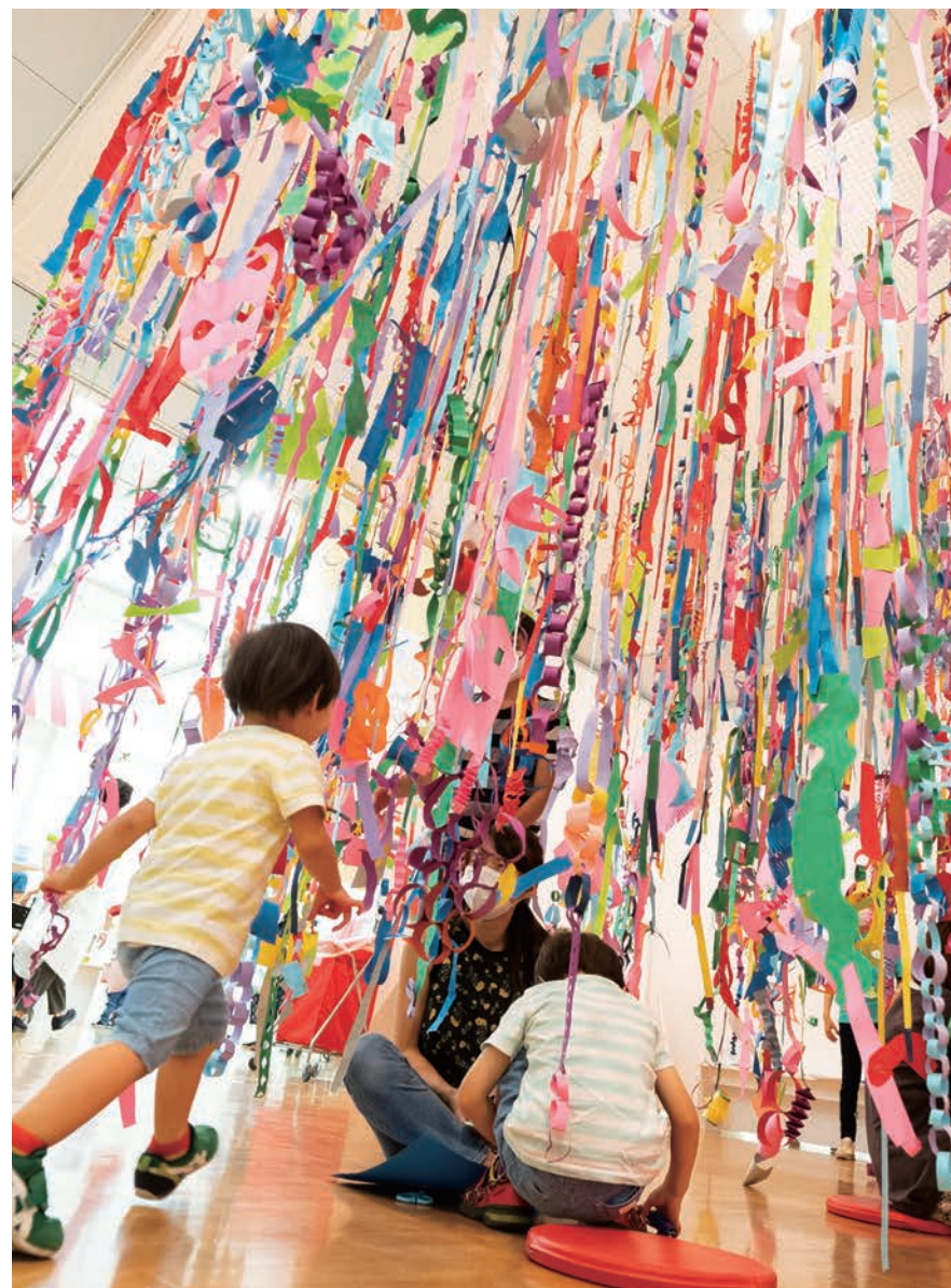
あざみ野こどもぎやらりい 2022 ぞうけいらボの様子