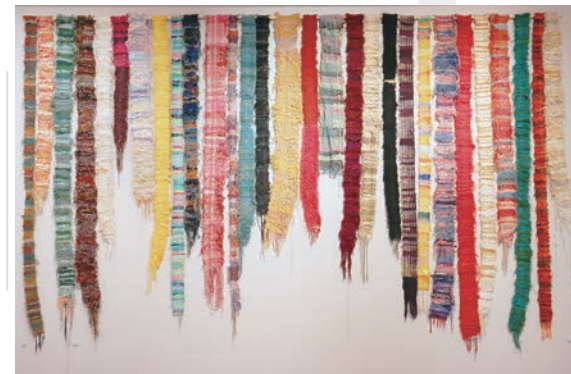
(miamoo. -ミアムウ-) 2010-2020年 / 毛、麻、綿、ポリエステル