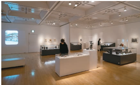
1. 「写真をめぐる距離」会場風景 2. 「潮田登久子 写真展 永遠のレッスン」会場風景