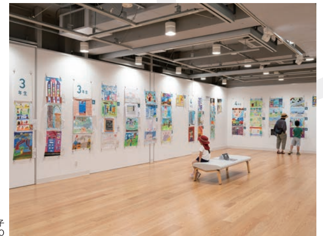
「横浜市こどもの美術展 2022」の様子