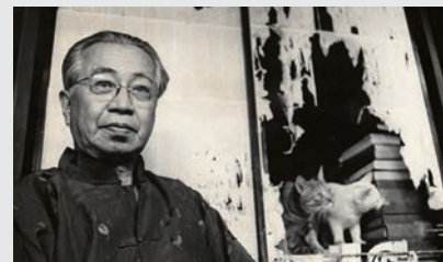
1964年(昭和39)大佛次郎 愛猫と

生涯に500匹の猫と暮らした、横浜ゆかりの作家・大佛次郎の没後50年を記念し、その生涯と作品、愛猫家ぶりを紹介する展示。