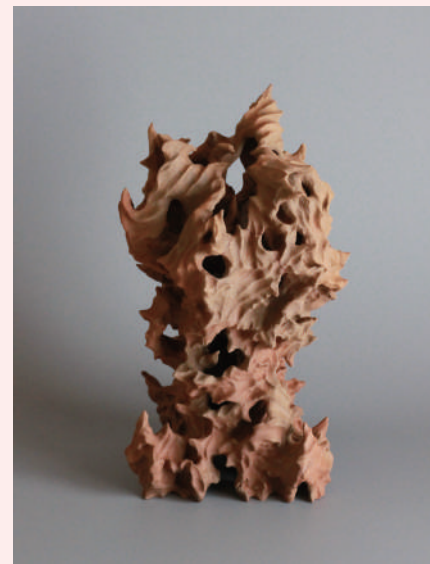
ヒルコ / 2020年 / 陶土

横浜市民ギャラリーあざみ野 3階アトリエでは、はじめての方でも楽しく制作を体験できるプログラムを開催しています。みなさまのご参加をお待ちしています。