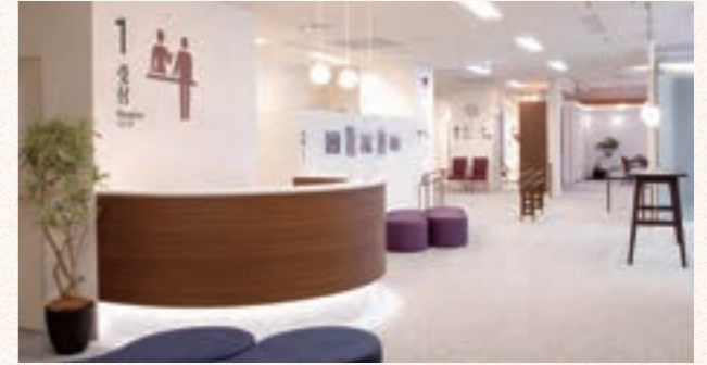
福岡市認知症フレンドリーセンター