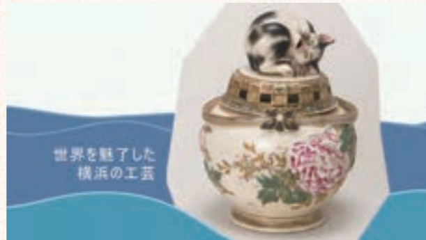
初代 宮川香山《高浮彫牡丹二眠猫覚醒大香炉》田邊哲人コレクション (横浜美術館に寄託)

リアルな立体装飾で欧米の人々を驚かせた「真葛焼 (マクス・ウエア)」、緻密さと大胆さを併せ持つ「芝山漆器」、上質な日本のシルクを使ったドレスや装身具など、横浜の輸出工芸の魅力や、美術の東西交流に詳しい沼田英子氏にわかりやすく解説いただけます。世界を魅了した横浜のものづくりの歴史を楽しく学んでみませんか?