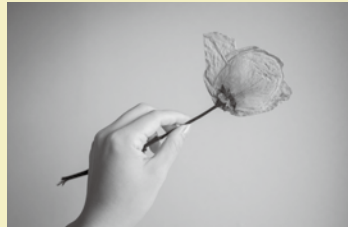
「緑の部屋」《花売りのおばあさん》