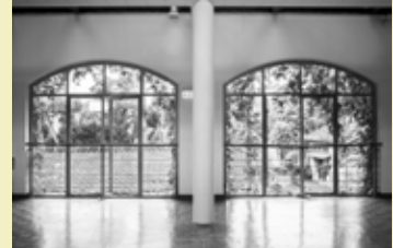
「緑の部屋」《幽霊たちの庭》